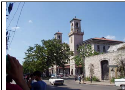
Estación Central de Tren

camaradería Eloy Alfaro, caudillo de la llamada revolución liberal de 1895 en Ecuador.