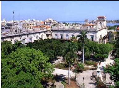
Plaza de Armas