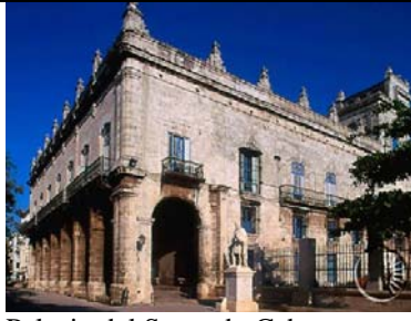
Palacio del Segundo Cabo