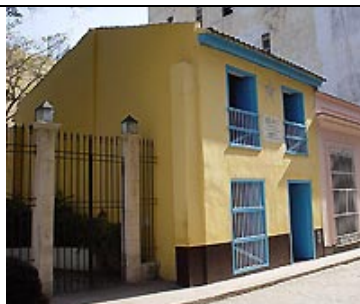
Museo de José Martí