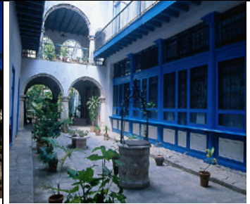
Casa del Obispo

Nos llamó la atención un palacio antiguo. ¿Qué funciona aquí? preguntamos a un hombre con apariencia de tener más de cincuenta años y una mujer joven que estaban disfrutando del fresquito en el zaguán. Es la oficina del historiador de la Habana, el antiguo palacio que en su tiempo fue del Segundo Cabo y Casa de Correos durante la colonia, respondieron y a partir de ese momento, directamente le hice algunas preguntas al hombre acerca de la realidad cubana y le escuché con atención. Me gusta la historia dijo. He empezado a leer la de Guatemala. De joven había sido indiferente a la política, sin embargo con la revolución, como todos los de su edad, luchó por tener esta patria, dijo emocionado haciendo memoria de muchos recuerdos de la realidad vivida y de la agresión constante de Estados Unidos. Hemos tenido numerosos momentos difíciles: cuando la invasión yankee en tiempos de Kennedy pero sobre todo, después de la caída de la Unión Soviética; días en los que periódicamente teníamos que aumentar los agujeros del cinturón. Momentos más duros