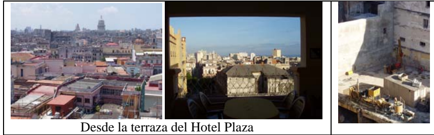
Desde la terraza del Hotel Plaza

que lo había pagado yo. Ahora tiene una floristería en Madrid y ya ha llevado a sus padres.