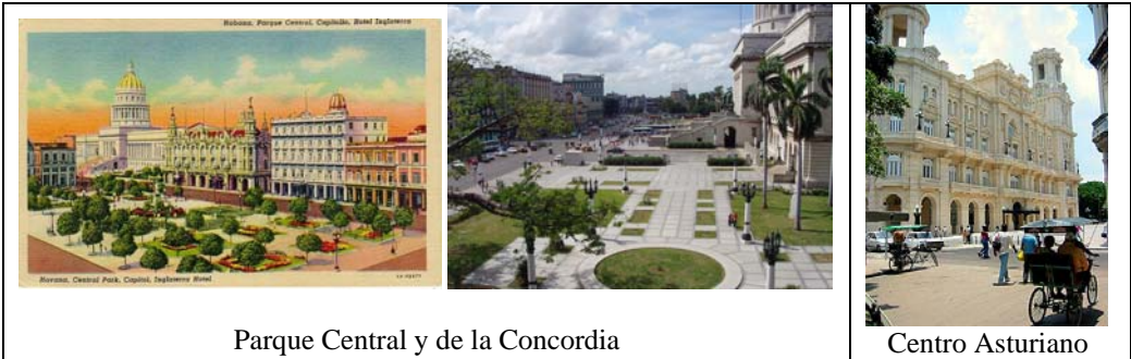
Parque Central y de la Concordia

Nos alojamos en el hotel Plaza, uno de los dos más tradicionales de la Habana en el que también habían pernoctado Einstein y Hemingway; el otro es el Inglaterra, inaugurado en 1875 donde habían sido huéspedes Caruso y Rubén Darío.