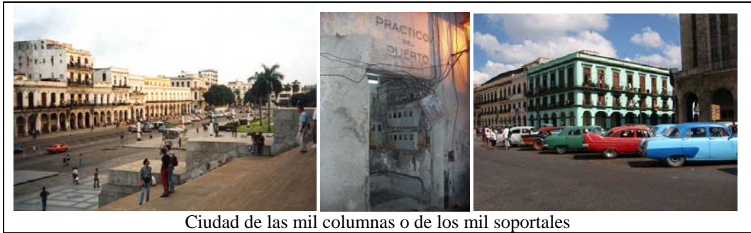
Ciudad de las mil columnas o de los mil soportales

del interior del país, en abarrotadas multifamiliares porque desde hace diez años no se ha construido ni un solo plan masivo de vivienda similar al de las décadas anteriores. Los soportales, contrariamente a cuanto podría pensarse, obedecen a la ordenanza 1861 que obligaba a construirlos en todas las calles de primero y segundo orden.