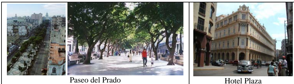
Paseo del Prado

Subimos por el Paseo del Prado un hermoso boulevard más bonito e interesante que La Rambla de Barcelona pero sin vidilla. A medio camino encontramos el centro andaluz. Nada que ver con la magnitud de otros semejantes Ya era tarde, no nos dejaron entrar.